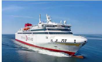
M/S Gotland (2019)