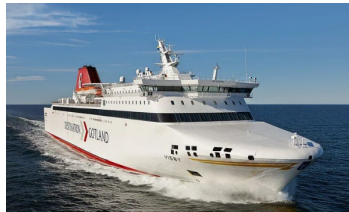
M/S Drotten (2003)