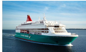
M/S Nordic Pearl (1989)