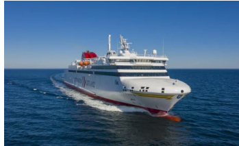
M/S Visby (2018)