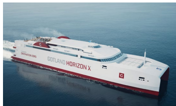
Gotland Horizon X (2028)