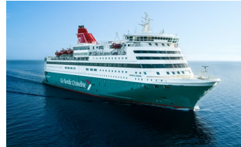
M/S Nordic Crown (1994)