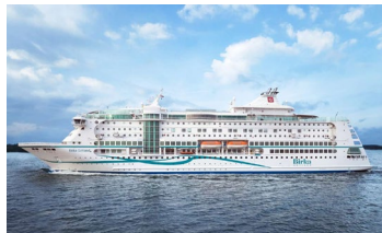
M/S Birka Gotland (2004)